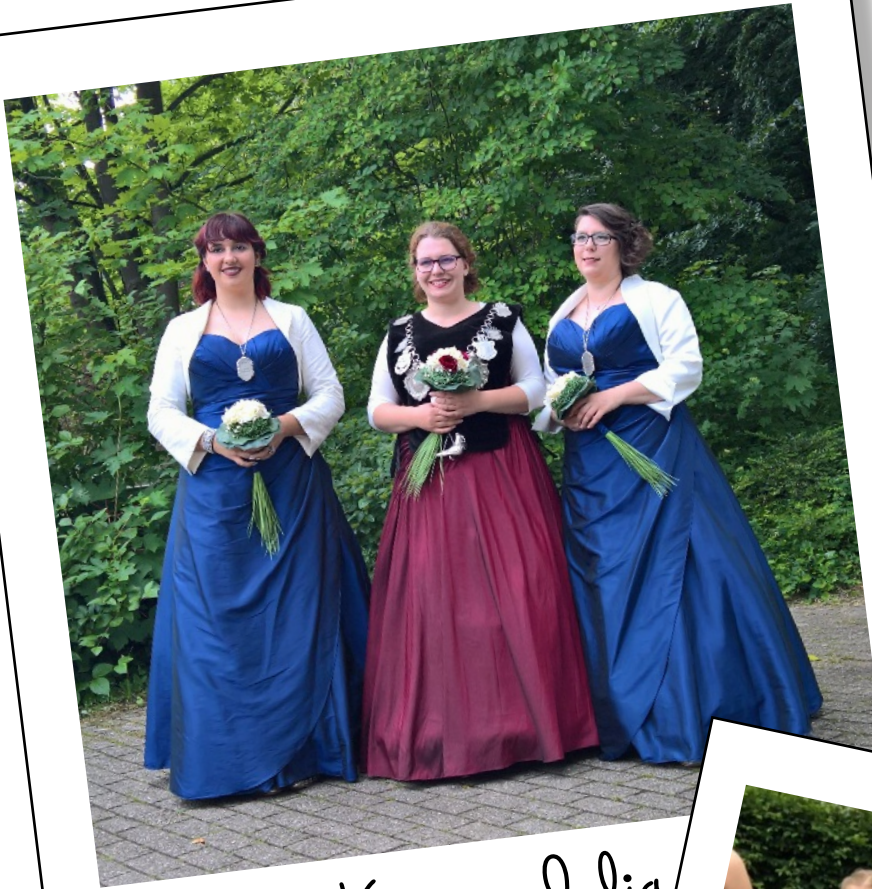
Königin Julia 2018