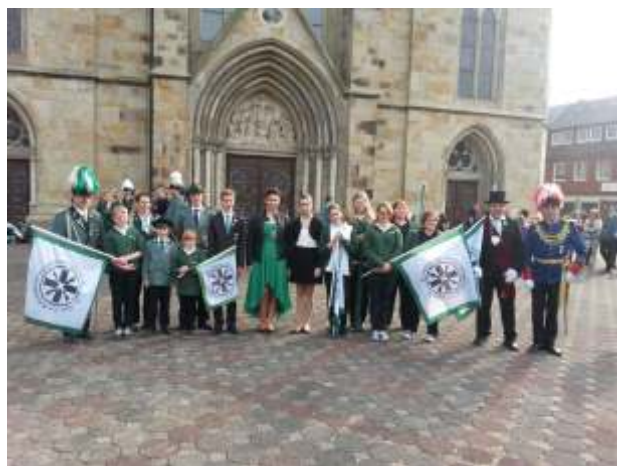
Unsere tolle Truppe vor St. Victor in Damme

Showschwenken an und feuerten unsere Synchron- Pagengruppe während ihres Auftrittes an. Die Zeit bis zur Siegerehrung am Abend überbrückten wir auf dem Sportplatz, auf welchem kleine Spiele aufgebaut waren. Um 17:00 Uhr begann dann endlich, die von uns herbeigesehnte Siegerehrung. Wie erhofft schnitten wir auch dieses Mal wieder gut ab.