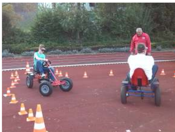
Mit der "Promillebrille" durch den Parcours war nicht einfach (es wurden optisch 1,5 Promille Alkohol im Blut simuliert)

Am Samstagmorgen starteten die Wettkämpfe im Synchron- und Einzelschwenken. Wie jedes Jahr waren wir in vielen Disziplinen zahlreich vertreten. Wir traten im Einzelschwenken in den Klassen Pagen 1, 2, 3, B1, B2 und A2 an, sowie im Synchronschwenken in der Pagenklasse und in der Offenen Klasse. Währenddessen waren unsere Schützenjungs auf einem Tagesausflug im Schwimmbad und hatten dort viel Spaß. Um diesen anstrengenden und aufregenden Tag zu feiern, gingen wir zur Party im Schützenzelt. Alle hatten Spaß und feierten ausgelassen die schon vergangenen Tage.