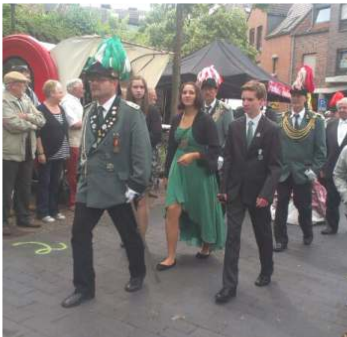
Schülerprinzessin beim Bezirksschützenfest in Wegberg

Vielleicht fragt sich der Eine oder Andere, was die Jungschützen so das ganze Jahr über erleben. Um Euren Wissensdurst zu stillen: hier eine Zusammenfassung des Jungschützenjahres 2014.