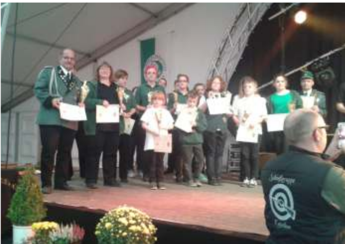
Siegerehrung bei den Bundesjungschützertagen