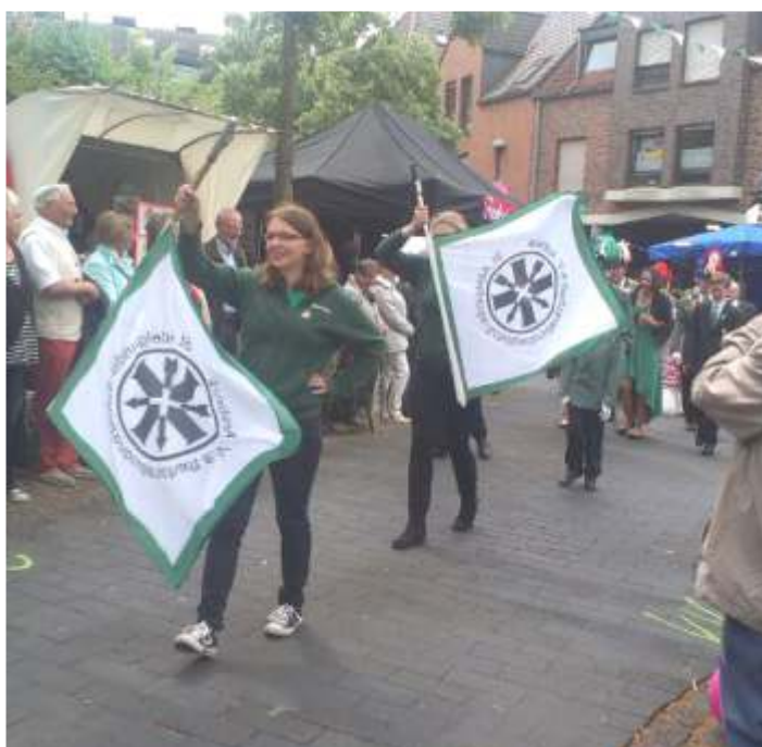
Fahnschwenker beim Bezirksschützenfest in Wegberg

Bei bestem Sommerwetter waren dort natürlich viele andere Besucher die erst mal beiseite gebeten werden mussten. Wir verbanden die Aktion außerdem mit einem Picknick und hatten alle zusammen einen super Nachmittag. Schon des-