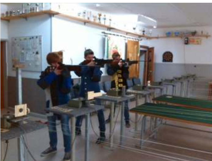
Schießgruppe beim wöchentlichen Training