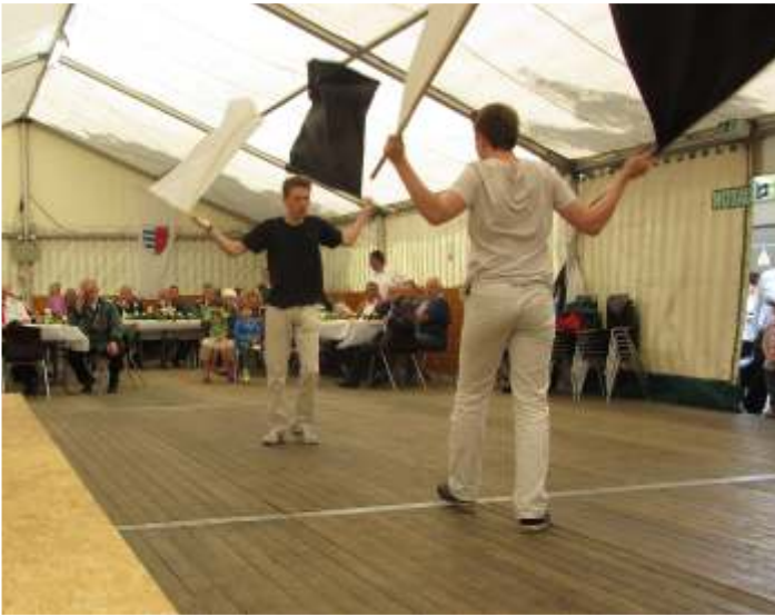
Fahnschwenker aus Kinzweiler auf der Sommerkirmes in Arsbeck

halb dankten wir für die Nominierung und wir brachten ein tolles Video ins Internet, auf dem der Spaß den wir hatten auf jeden Fall zu erkennen ist.