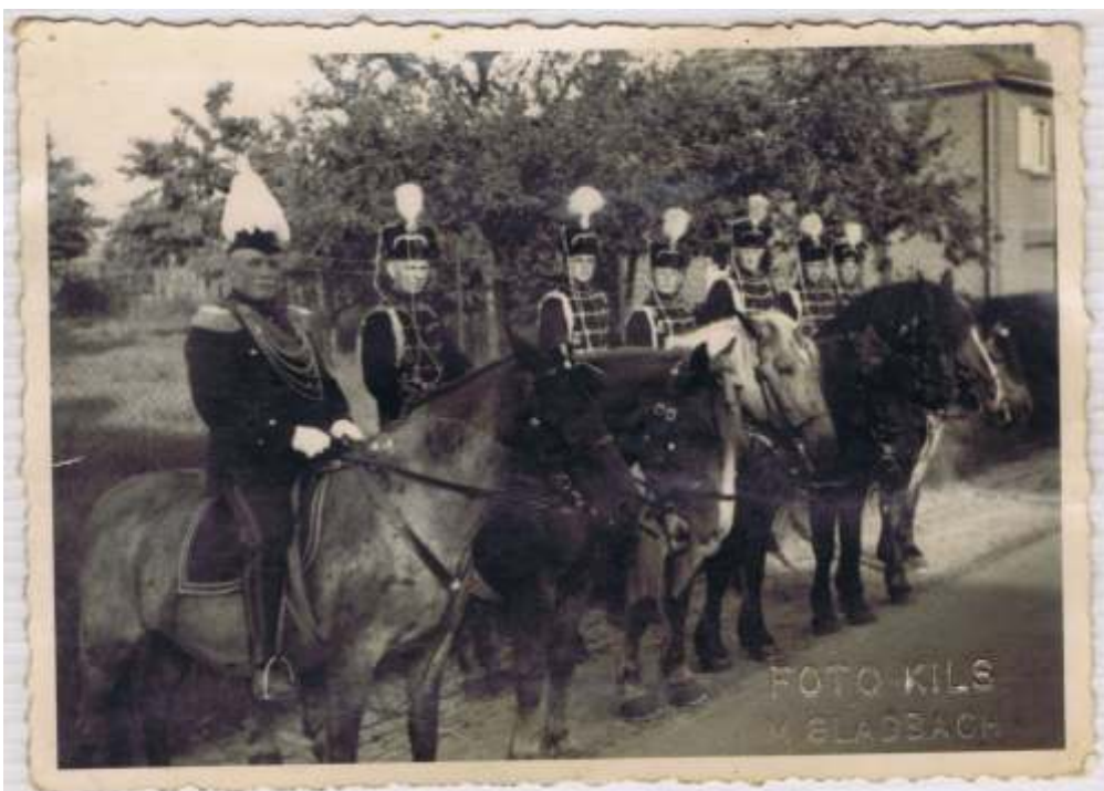
1937: Arsbecker Husaren zu Pferd. Es gab allerdings auch danach noch Husaren in Arsbeck.

In Vorbereitung ist außerdem eine Festschrift, in der wir die Bruderschaft und Arsbeck vorstellen und das Fest dokumentieren wollen.