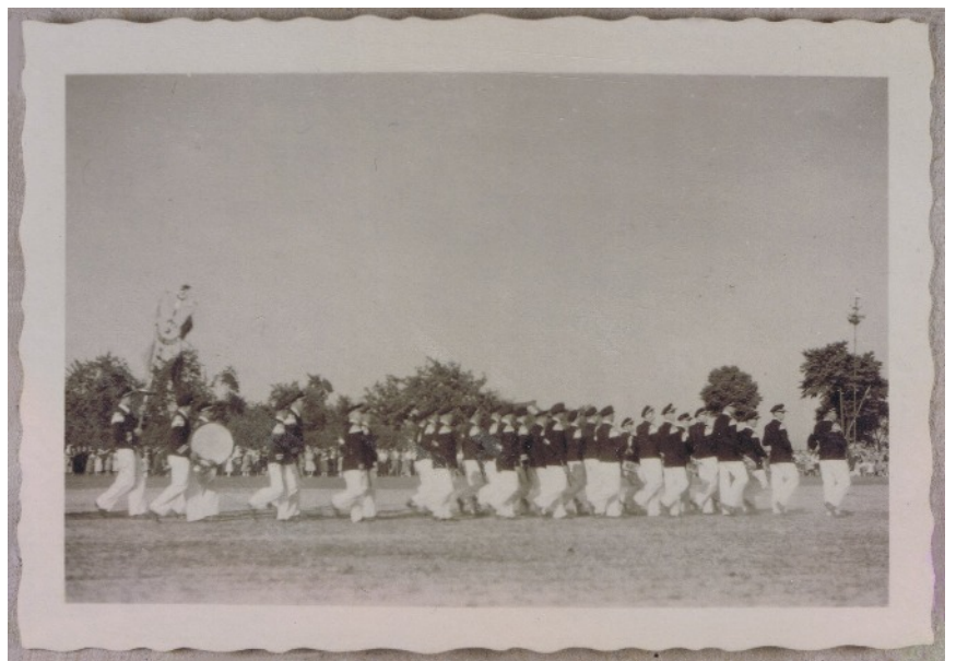
1948: Trommelchorps beim Umzug

Die mittelalterlichen Vereinigungen umfassten alle Bereiche des Lebens: Religiöse, soziale und wirtschaftliche Bedürfnisse wurden gleichermaßen abgedeckt. Wer einer Zunft oder Bruderschaft angehörte, konnte sich darauf verlassen, dass diese Gemeinschaft ihn tragen würde, wenn er plötzlich verarmen sollte, ihm das Haus abbrannte oder er krank wurde. Für sein Seelenheil würde auch nach seinem Tod gebetet werden, ein christliches Begräbnis war garantiert. Die Menschen des Mittelalters waren auch in ihrem Alltag enger mit der Kirche verbunden, als wir es heute sind. Sie richteten ihr gesamtes Leben danach aus. Die Städte wetteiferten darin, große, hohe Kirchen und Dome zu bauen. Die Zünfte und Gilden stellten sich unter den besonderen Schutz eines Heiligen und finanzierten ihm zu Ehren oft einen Altar. Dort ließen sie einen Geistlichen täglich die Messe lesen. Verstöße gegen die Satzung der Gemeinschaft wurden mit Wachs für die Kerzen dieses Altares bezahlt. Je nach Handwerk und Bedürfnis waren bestimmte Heilige zuständig: Katharina war z.B. die Patronin der Wagner, weil ihre Legende sagt, dass sie gerädert werden sollte. Die Schiffer und Seefahrer riefen Nikolaus um Hilfe an, der einst ein Schiff im Sturm beschützt haben soll. Agathe sollte die Stadt vor Feuer schützen, der Goldschmied Eligius war Patron der Schmiede und Goldarbeiter. Der Zimmermann Josef ist bis heute Patron aller in diesem Handwerk Tätigen.