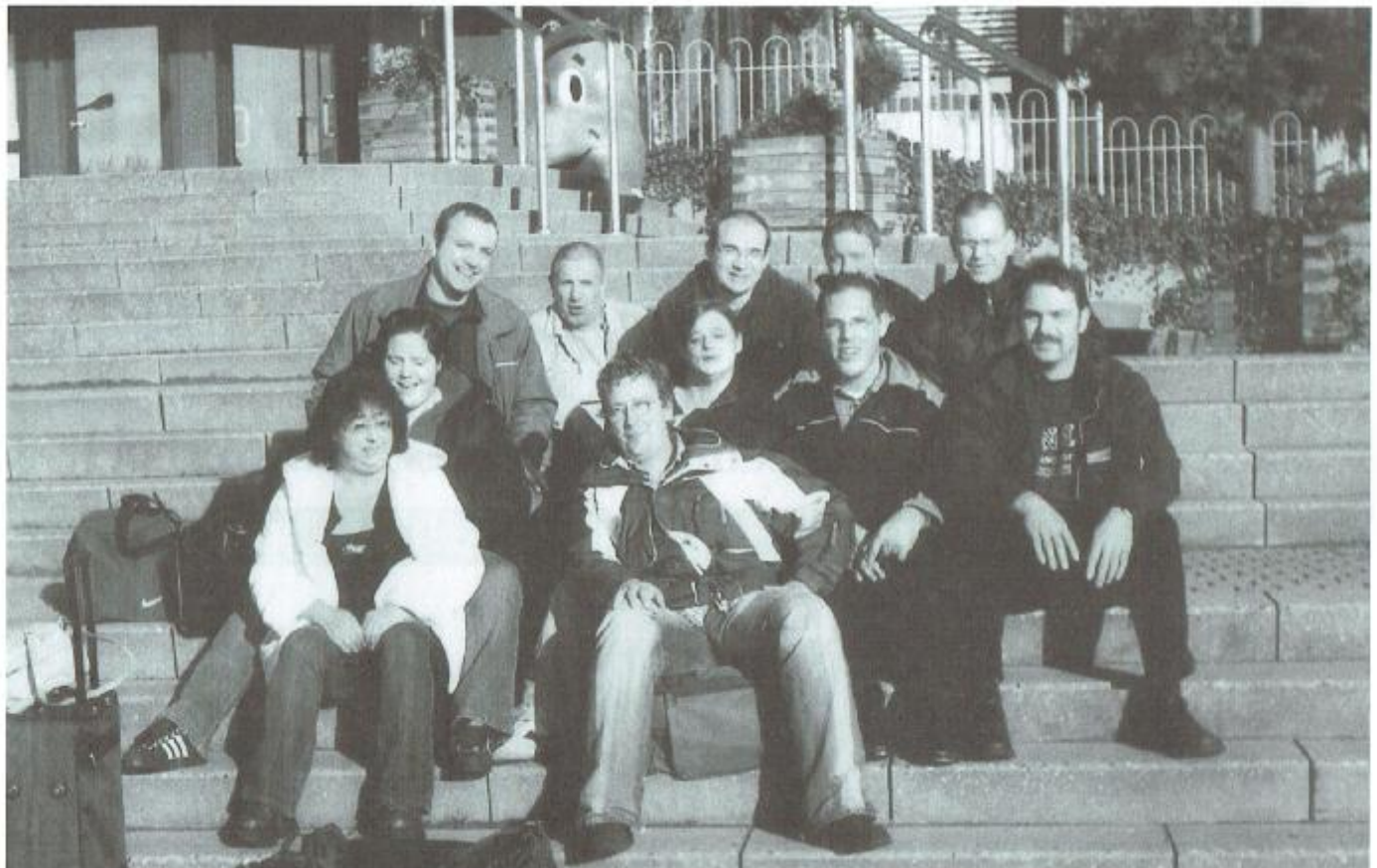
Ausflug des Grenadier- und Jägerzuges ins Kernwasserwunderland nach Kalkar!